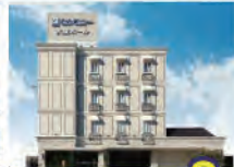
ニューシトル「鉄道博物館駅」徒歩 8分 大成ホール 0120-75-4488