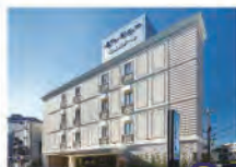
JR「北浦和駅」東口 徒歩 6分 北浦和ホール 0120-07-8000