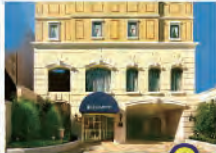
JR「大宮駅」東口 徒歩 6分 大宮ホール 0120-25-6411