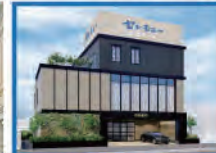
浦和美國ホール 2025年オープン