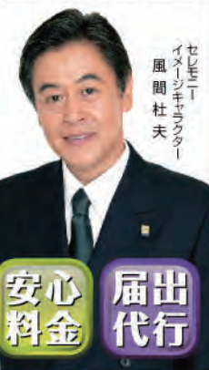
セレモニー イメージキャラクター 風間 杜夫