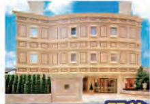
JR「与野駅」西口 駅前 与野ホール 0120-27-8825