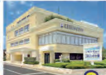
JR「指扇駅」南口 徒歩 8分 コスミック大宮 0120-01-5439