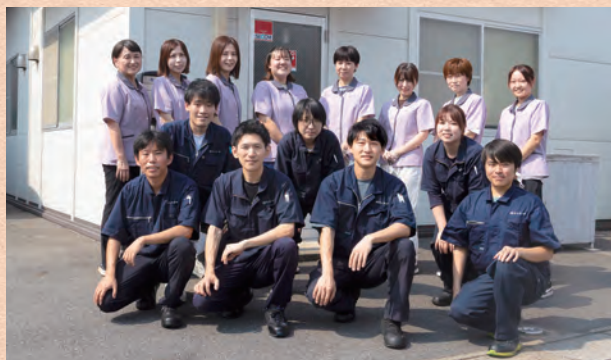
「こうしたら良い商品ができるんじゃないか」意見を聞き入れてもらえ、成長を感じられる環境だから職員も活き活きです

彩の国オープンファクトリーを盛り上げるため、地元中学生がインタビューに訪問。中山工場長が答えます