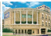
JR「武蔵浦和駅」東口 徒歩 5分 武蔵浦和ホール 0120-10-0080