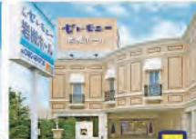
東武線「岩槻駅」徒歩 7分 岩槻ホール 0120-46-0700