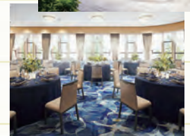
2024年にリニューアルオープンする清水園新館。優美な姿の新たなランドマークが生まれる。