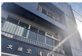
屋号「文雅堂」は職人による丁寧な仕事の象徴でもある

うちには「文雅堂」という屋号がありますが、かつて「堂」の付く経師屋は県内でも3軒ほどといい、いずれも勝海舟が名付け