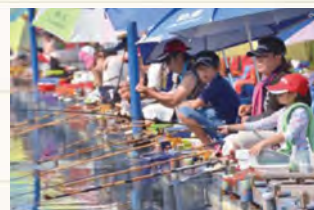
恒例のヘラブナつり大会は、子どもたちが自然や命と向き合う貴重な機会に。

創業115年を目前に控え、当社はこれからもより広い意味で「つり文化」「ウォーターレジャー」振興に携わっていきつりです。より楽しく安全につりができる環境整備をしたり、自然と触れ合う機会の減った子どもたちに、つりの楽しさを伝えたり。まだまだマルキユーにはできること、すべきことがあると、次代に託す未来を楽しみにしています。