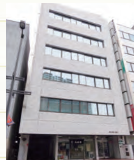
1983年、もらい火で店舗を焼失して建て替えられた木崎屋ビル。2004年、OAフロアに対応する大改修で、現在の姿に。