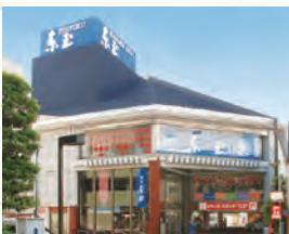
4代目が駅前に立ち上げた旧店舗。現在は店舗・工房を併設した岩槻の名所となっている。