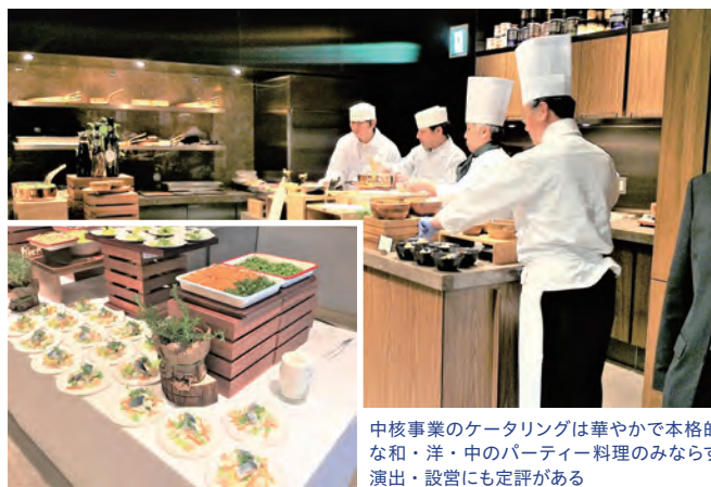
中核事業のケータリングは華やかで本格的な和・洋・中のパーティー料理のみならず演出・設営にも定評がある

私が入社した2000年ごろから多彩な郊外型飲食チェーンの展開を活性化し、焼肉店を開いて1周年を迎える矢先、狂牛病騒動に見舞われました。飲酒運転罰則の厳格化や大型店舗の進出などでお客様の流れが変わったこともあり、事業の重点をケータリングや仕出し事業に転換。2012年に東京・練馬区に最新の冷凍技術を活用した「料亭工場」を稼働し、コンセプトショップとして「銀座割烹里仙」を開店しました。2013年から冷凍おせちをはじめ高級冷凍食品の販路を広げるなど事業が順調に動き出していたところに、今度はコロナ禍が直撃です。それも事業を見直す好機と捉え、現在は新たな成長戦略としてM&Aにも本格的に取り組んでいます。