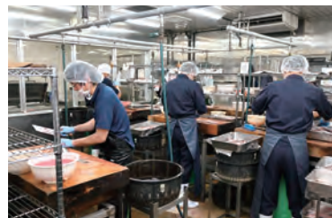
鯉平では年間160トンものうなぎを熟練の職人が素早く丁寧に捌く

父がいつも、「先人の“諦めずに生き残る”という強い信念のおかげで今日がある」と言っていました。私もその言葉の重みを受け止め、鯉平が生き残ることが業界の発展と“うなぎ”という日本の食文化を守ることだと考えています。