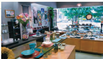
広い間口から街路樹を望む店舗。日本中の名窯から選んだ美しいうつわが並ぶ。

「わた忠」というのは、綿布の仲買人をしていた初代がつけた屋号で、創業は江戸・寛政年間(1790年代)と伝わっています。