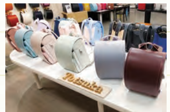
お内裏様が赤ちゃんを抱く子育て雛など、コンパクトで個性的なオリジナル雛が好評。ランドセル事業は同社の新たな柱となった。

ちなみに私は次男なのですが、長兄は小児科医となり、本店向かいの東玉ビルで開業しております。どこまでもお子さまの幸せと健やかな成長に尽くす。それが戸塚家の歩む道のようなのです。