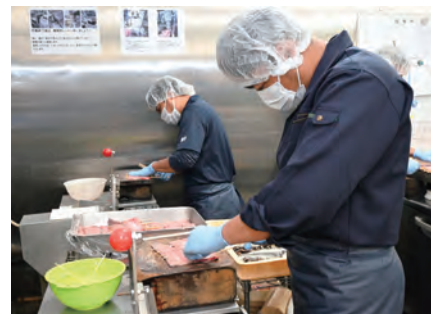
自社開発のうなぎ串打ち機で効率的に串打ちし、職人が手直して丁寧に仕上げ

生き残り、世界に日本の“うなぎ”文化を広げ、多くの人に喜んでもらう。創業以来変わらぬ私たちの存在意義だと感じています。