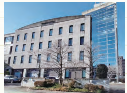
事業拡大に伴い1993年にさいたま市に移転。この他、福島県南会津に製造拠点を展開している。

素晴らしい成果を上げてくれる社員たちに、よりよい環境・待遇を整えれば、結果として業績は伸びていく。だから「現在の良い状態を維持する」が私の使命だと思っています。