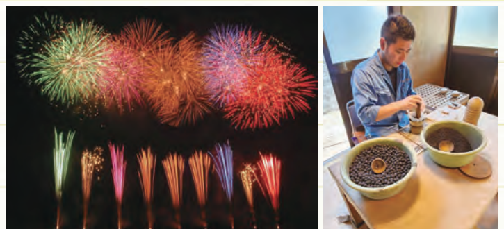
創業120年の伝統と、革新性をあわせもった花火と、技術を磨き続けている。

さいたま唯一の花火業者として、地元企業や関係各所、花火を愛する皆様にぜひご協力いただき、大輪の花を大空に咲かせ続けたいと思います。