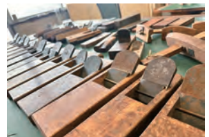
代々の職人によって繰り返し繊細に調整され、木製の台に艶が出るほど使い込まれた鉋

私は「幸せ」という言葉が大好きなんです。まず私と家族が幸せを感じなければ、社員・地域に愛されること、社会へ貢献することを謳っても、絵空事になりかねない。家業を継いで四半世紀の実