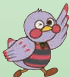
埼玉県のマスコット 「さいたまっち」

申込方法 裏面をご覧ください、 FAX または埼玉新聞ホームページの 応募フォームからお申し込みください。